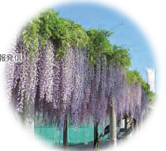
藤島地域のシンボル「藤」