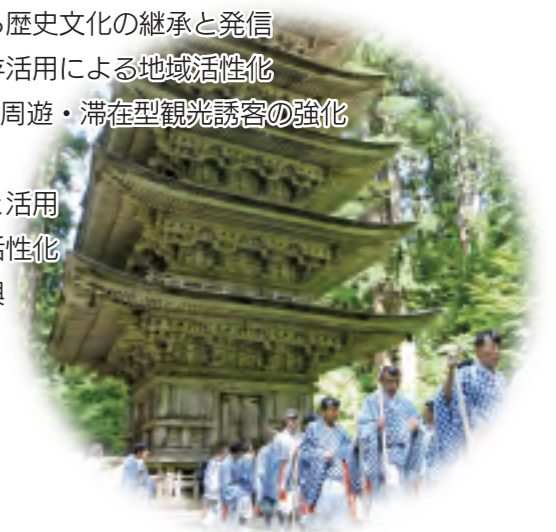
国宝 羽黒山五重塔