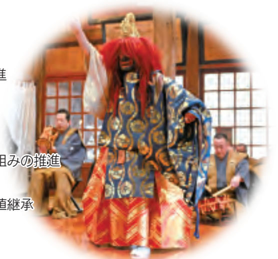
国の重要無形民俗文化財 黒川能