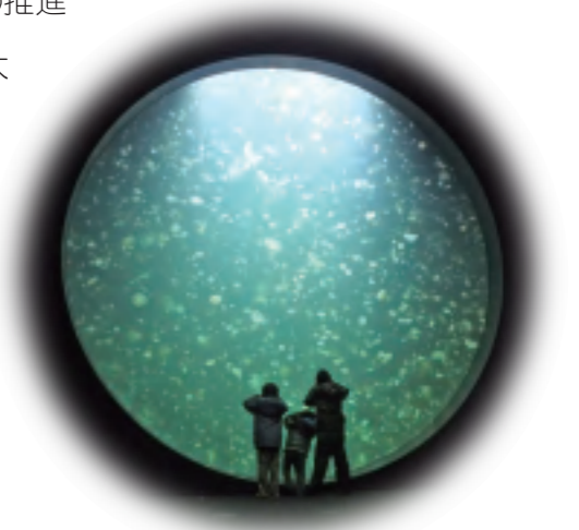
クラゲドリーム館（加茂水族館）