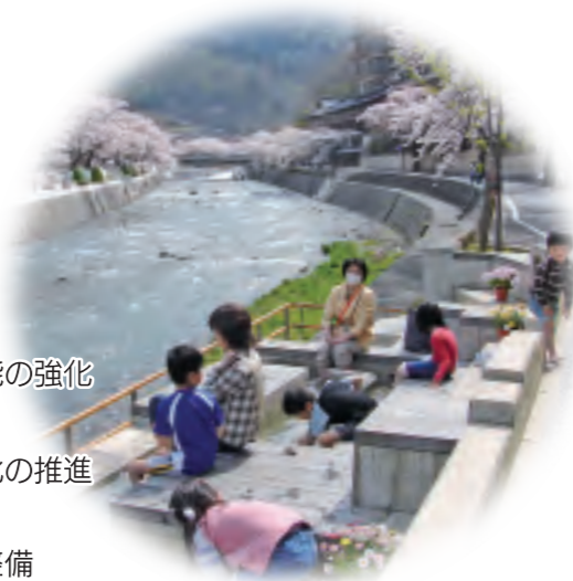
あつみ温泉の足湯「もっけ湯」