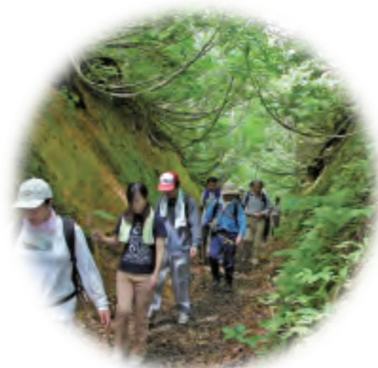
六十里越街道 大堀抜