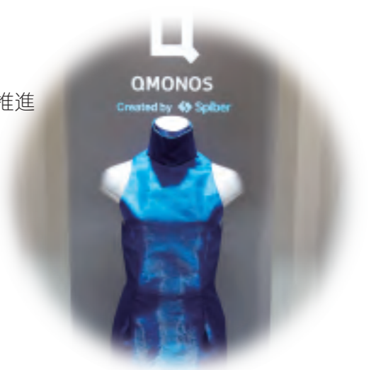
鶴岡市のバイオベンチャー企業が開発した 人工合成クモ糸素材