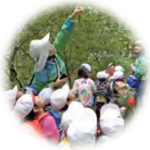
自然環境を体験する森の保育事業