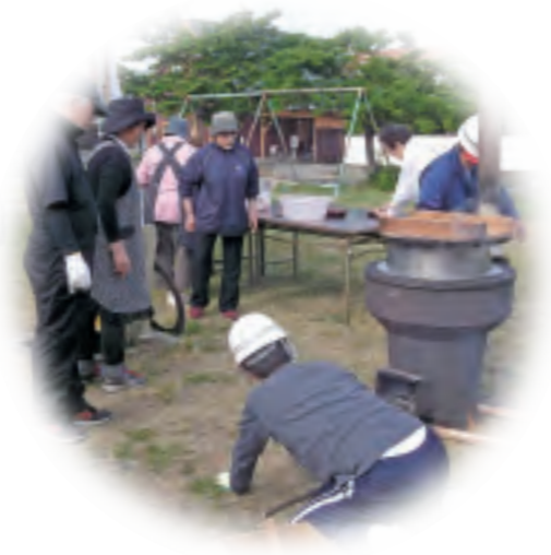
地域住民が参加した防災訓練