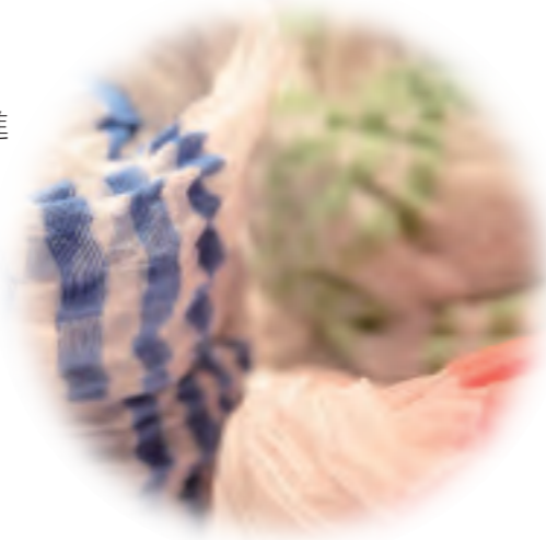
鶴岡シルクのスツール